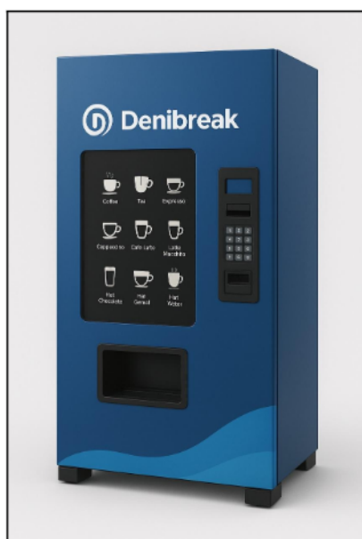
DISTRIBUTORE AUTOMATICO MONVISO